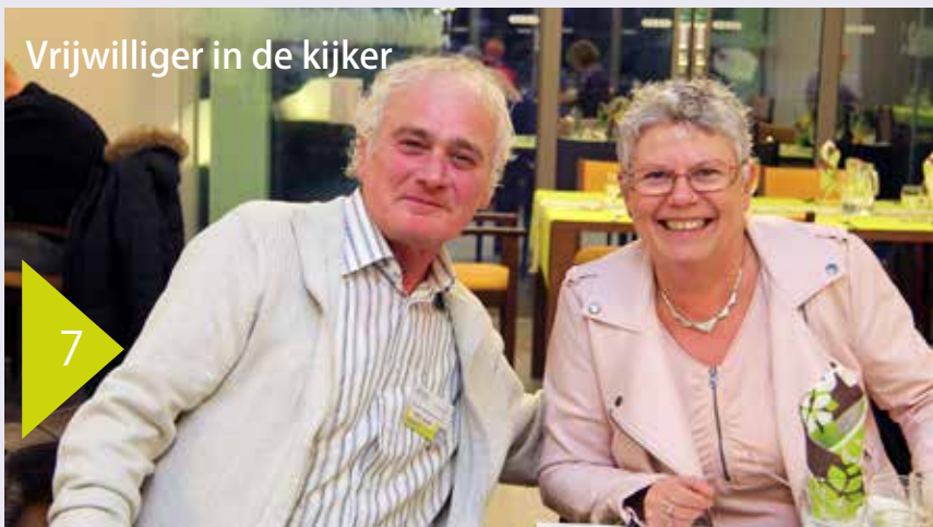
Vrijwilliger in de kijker