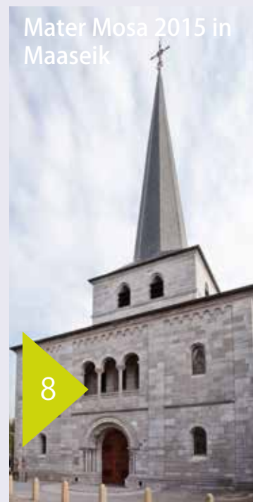
Mater Mosa 2015 in Maaseik